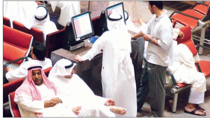
• الفترة صعبة في السوق رغم ارتفاع المؤشرات

قال التقرير الأسبوعي لشركة بيان للاستثمار إن سوق الكويت للأوراق المالية استطاع أن يواصل تحقيقه للمكاسب خلال الأسبوع الماضي رغم تذبذبه الواضح خلال معظم جلسات الأسبوع. فقد تمكن مؤشر السوق السعري من تجاوز حاجز الـ ٧,٦٠٠ نقطة ومن ثم مستوى الـ ٧,٧٠٠ نقطة خلال الأسبوع، في حين تخطى المؤشر الوزني حاجز الـ ٤٠٠ نقطة، وذلك على الرغم من تراجعهما صعوداً وهبوطاً على مدى فترات التداول. وقد تراقق هذا الصعود المتذبذب مع حركة تداولات نشطة ارتفعت معها مؤشرات التداول الثلاثة وأوصلت كمية التداول اليومية إلى مستويات غير مسبوقة، ويعود السبب في اشتداد حالة التذبذب إلى هيمنة الحذر على تعاملات المتداولين، وهو ما تجلّى من خلال سيطرة المضاربات بموازاة عمليات جني الأرباح المتواصلة. فقد ازداد تخوف المتعاملين من إيقاف عدد كبير من أسهم الشركات المدرجة عن التداول، إذ لم تعلن عن نتائج الربع الأول من العام الحالي سوى ٤٧ شركة حتى الآن، أي ٢٣٪ تقريباً من إجمالي الشركات المدرجة في السوق الرسمي، ولم يتبق من المهلة المحددة للاقصاص سوى أسبوع واحد فقط. هذا وتأتي تداولات الأسبوع امتداداً للتحسن في الأداء العام للسوق والذي بدأ في شهر مارس الماضي، علماً بأن الربع الأول من العام قد شهد أسوأ أداءات الأزمة المالية العالمية على الأسواق المالية، حيث انخفضت الأسواق العالمية بشكل عام وأسواق المنطقة بشكل خاص ووصلت إلى أدنى مستوياتها لهذه السنة خلال الشهور الثلاثة الأولى من هذا العام.